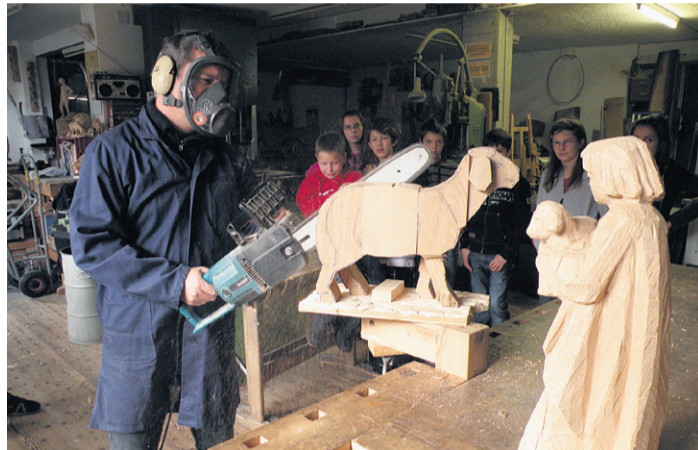
Die Figuren sind vor allem mit der Motorsäge ausgearbeitet worden.

Die elf Figuren und vier Tiere sind hauptsächlich mit der Kettensäge gearbeitet. Nur die Gesichter, Hände und Füsse sind noch etwas feiner mit dem Bildhauermessel ausgearbeitet. Ganz schön ist zum Beispiel, wie treffend die Herkunftsorte Asien, Ägypten und Afrika nur schon in den Gesichtern der drei Könige zu erkennen sind.